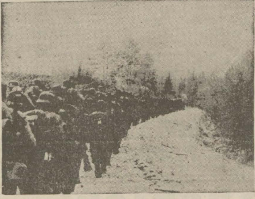
Sovyetlerle çarpışmak üzere şark cephesine gönderilen Fransız gönüllüleri