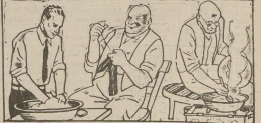
(Yazısını 3 üncü sayfamızda bulacaksınız)

Hal ve vakitleri yerinde iken muhtelif sebeplerle dünya evine girmiyen sayıları dikkat tipler Yazan: Profesör doktor Sadi İrmak