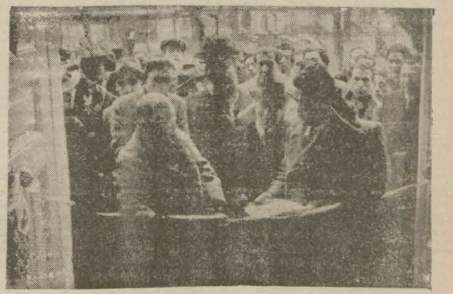
Parti Başkanı dün iş bulma ve kurtarma yurdunu açarken

Halkevi kuruluşunun 10 uncu yıldönümü münasebetle bugün memleketin her tarafındaki Halkevlerinde merasim yapılacaktır. Bu meyanda şehrimizdeki toplantılar saat 14 de başlanacak. 15 de Parti Genel Kurulunun toplantısı olacaktır. (Devamı 6 nci sayfada)